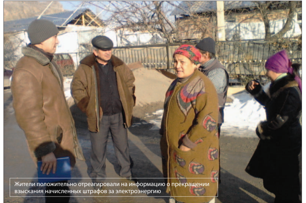
Жители положительно отреагировали на информацию о прекращении взыскания начисленных штрафов за электроэнергию

В деле Атаханова суд отметил явные нарушения в составлении акта о начислении