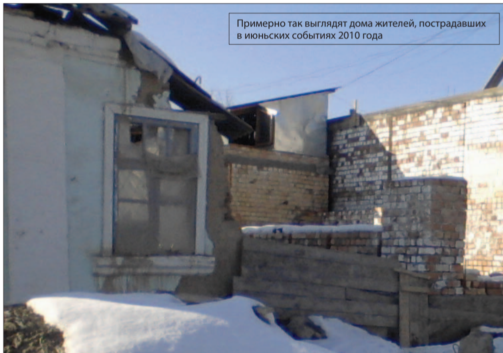
Примерно так выглядят дома жителей, пострадавших в июньских событиях 2010 года